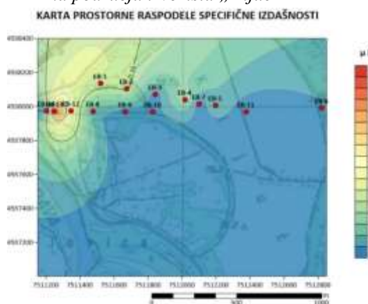
Slika 3 - Karte prostorne distribucije vrednosti specifične izdašnosti izdani na području izvorišta „Ključ“

U pogledu prostornog rasporeda vrednosti koeficijenta transmisivnosti, jasno se može videti da su najveće vrednosti u jugoistočnom delu izvorišta (bunari EB-14, EB-12, EB-10), dok idući ka severoistoku vrednosti opadaju. Vrednosti koeficijenta filtracije se povećavaju u severnom delu izvorišta. Vrednosti specifične izdašnosti najveće su u istočnom delu karte oko bunara EB-12 dok u severnom delu skoro da padaju na nulu. Navedeno predstavlja posledicu