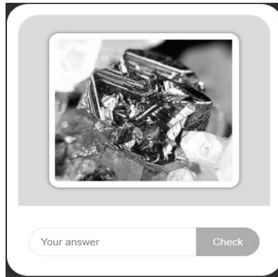
Slika 1: Primer leksičke kartice

Predavač jezika skreće pažnju studentima da identifikuju karakteristike akademskog govora kao neemocionalnog, činjenično zasnovanog, nasuprot lično zasnovanom, zatim razdvaja odnose uzroka i posledice, utvrđuje konektore poređenja i kontrastiranja, tehnički žargon naglašava u svim adekvatnim prilikama, preuzima rečnik iz drugih naučnih disciplina koje su relevantne za datu naučnu oblast. Materijali izrađeni po metodi CLIL nastoje da putem leksičkih kartica rečnik struke i nauke učine što vidljivijim, najpre dekontekstualizovano, a zatim kontekstualizacijom u što većem obimu.