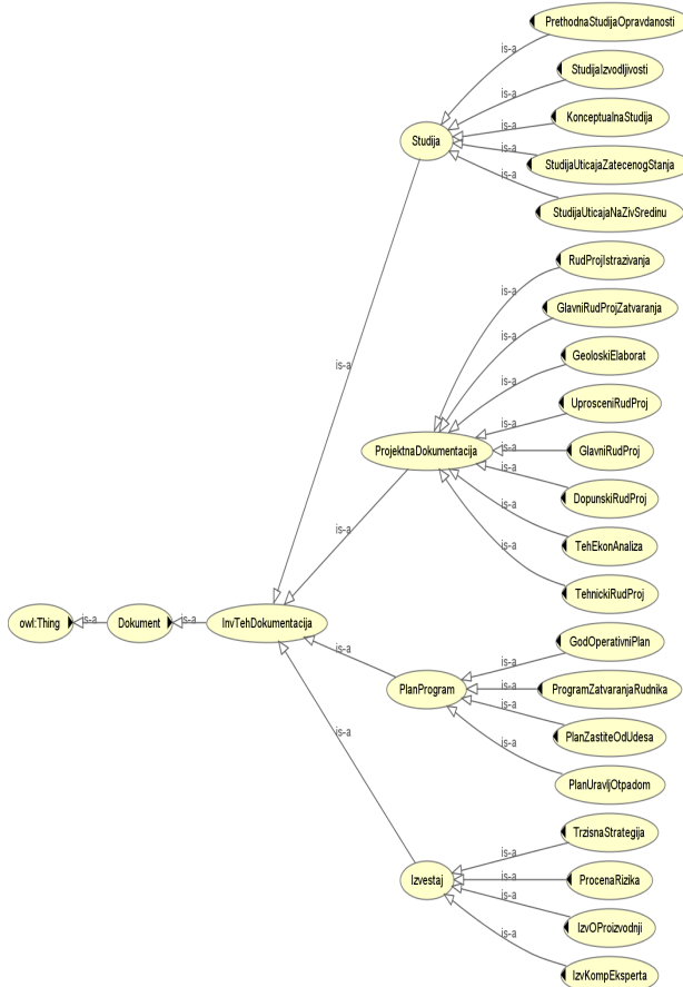
Слика 2 Визуелни приказ таксономије InvTehDokumentacija (Томашевић 2018: 134)

Коришћење онтологије RuDokOnto је од значаја за процес екстракције информација. Резултат екстракције информација заснованог на онтологији су подаци издвојених из текста. Ови подаци се могу приказати помоћу језика за креирање онтологије (OWL). Поред тога излаз могу бити и везе са текстуалним документима из којих су подаци издвојени, при чему излаз може садржати и везе са текстуалним документима из којих су подаци извучени. Ово је нарочито важно јер обезбеђује поузданије одређивање релевантности одговора који је понуђен кориснику на основу екстраховане информације.